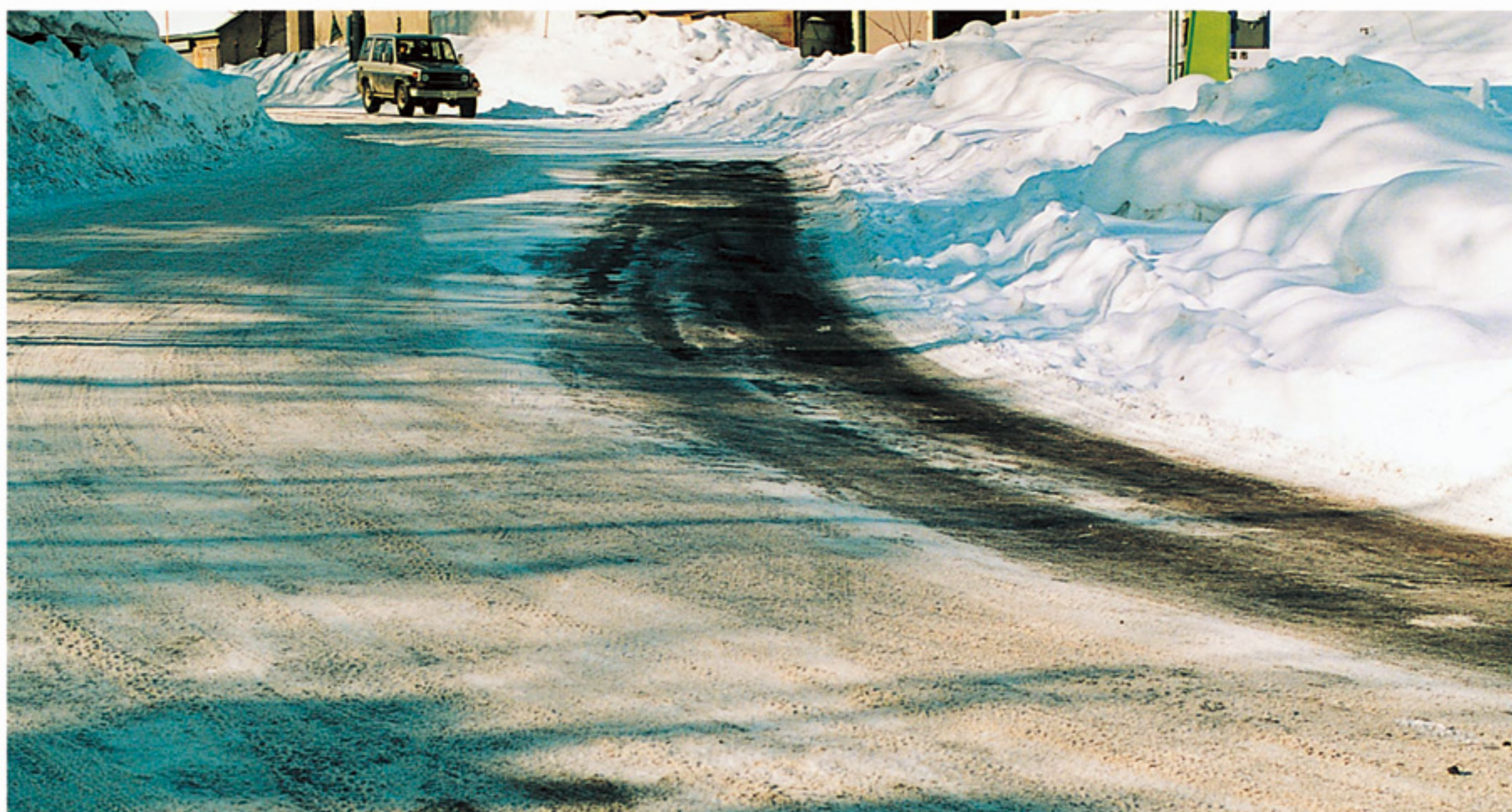
カマグ使用の路面状況

『オートカマグ』を設置することでリアルタイムに散布が可能となり、冬期路面管理の省力化が図れます。