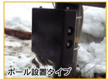
ポール設置タイプ