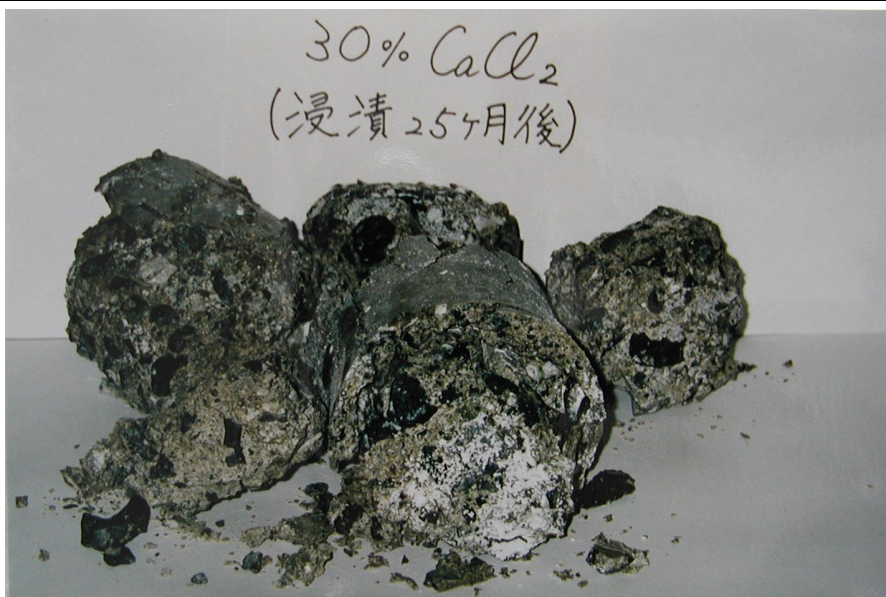
写真－3 塩化カルシウム