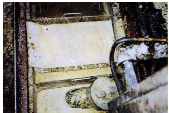
グリーストラップ Kシート