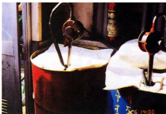
エンジン、ギアオイルドラム缶上部 Kシート