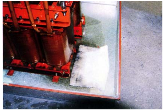
変圧器メンテ時の油吸着 Kシート