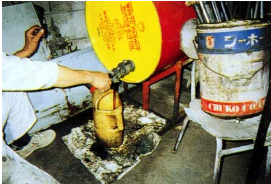
エンジンオイル小出し器 Kシート、F-50（フロアマット）