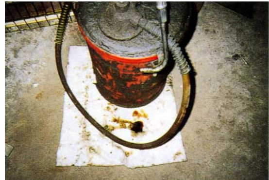
デフミッションオイル交換時 Kシート、F-50（フロアマット）