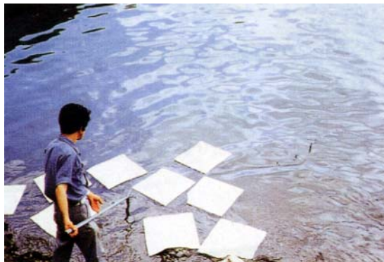
海上流出油吸着 Kシート、KPシート（型式承認）