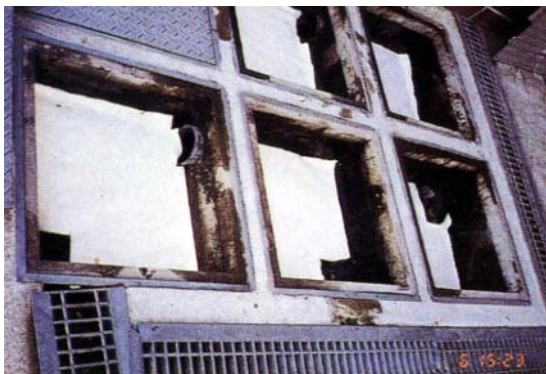
油水分離槽 Kシート