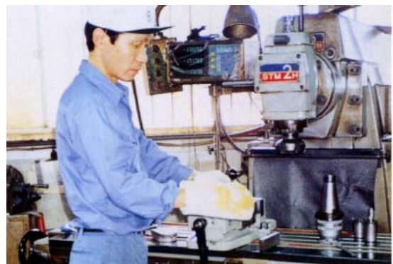
マシン周りの洩油の拭き取り SB-20、SB-30