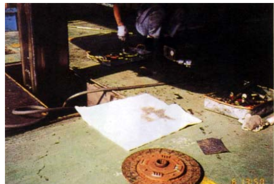
エンジンオーバーホール時の洩油吸着 Kシート、F-50（フロアマット）