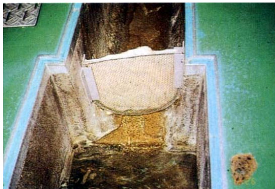
食品工場排水路 Lシート（L-50）