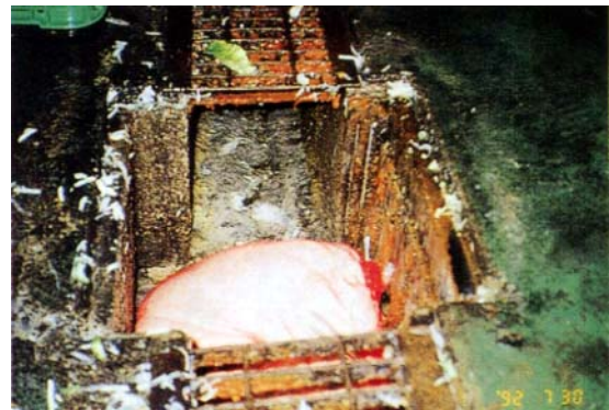
食品工場排水路の溜枘 KB-500（バルクタイプ）