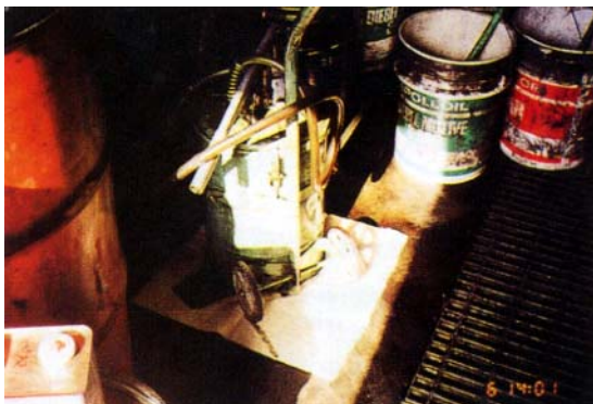
ギアオイル等の油庫の床面 Kシート、F-50（フロアマット）