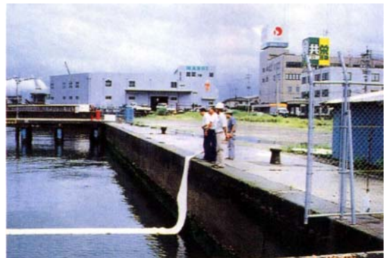
海上流出油吸着 KPロール状（型式承認）