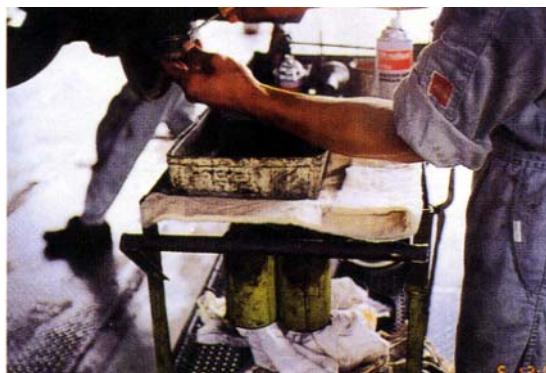
ブレーキドラム、ベアリング交換の油受け Kシート、F-50（フロアマット）